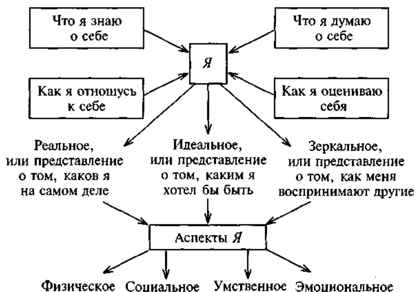
Рис. 2. Структура Я-концепции

ее характерные особенности. Схематически структуру Я-концепции можно изобразить следующим образом (рис. 2):